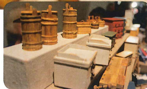
Britt-Mari Åblad Bästa bord mars 2019

Stockholms Miniaturmässa 19 oktober 2019